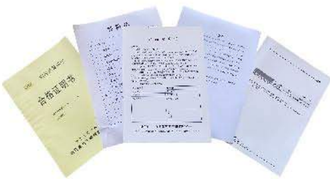
合格证, 保修卡, 技术资料 Qualification Certification/ Warranty Card/Instruction