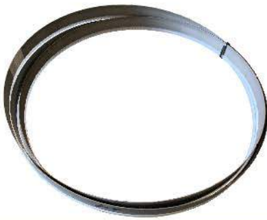
带锯条 Bandsaw Blade (1PC)