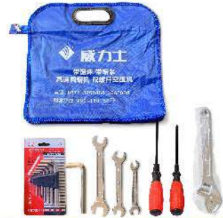
随机工具一套 Tools (1SET)