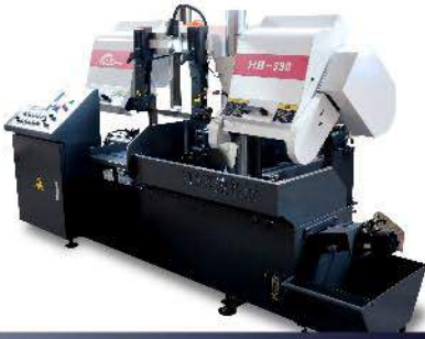
主机一台 Machine (1PC)