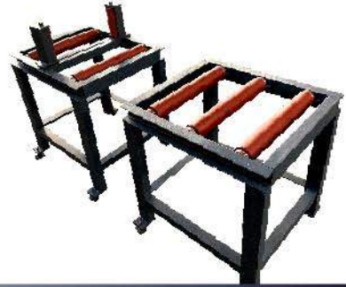
从动料架二个 Feeding Table (2PC)